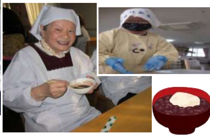
お手伝いして下さった皆さん ありがとうございました