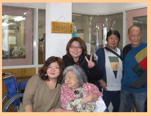
家族の みんなが きてくれました