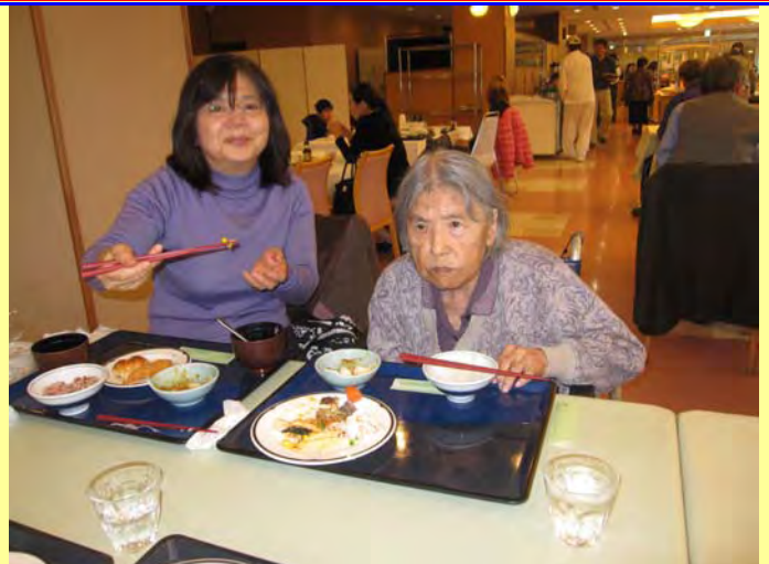
紅葉を見に行きました。サンロード吉備路で昼食♪ バイキングなので好きな物が食べ放題♪