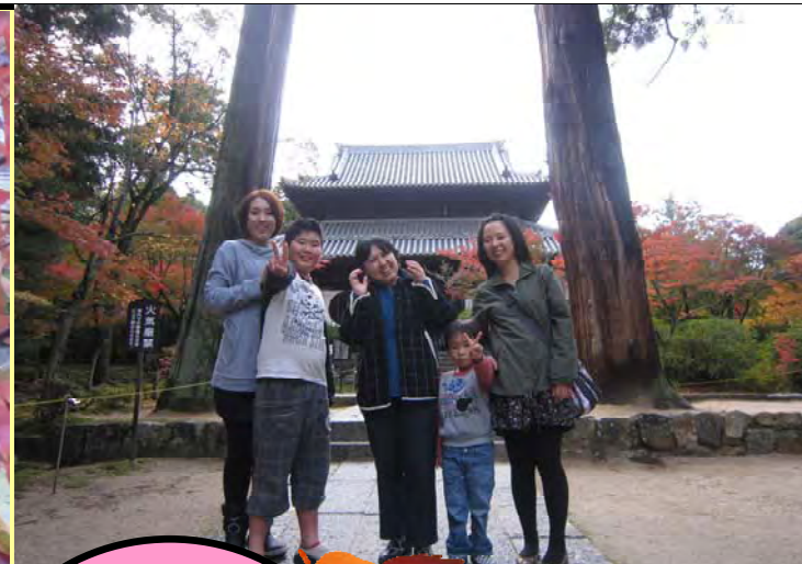
家族 みんな でハイ！ チーズ！