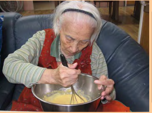
がんばり おかし作り ます